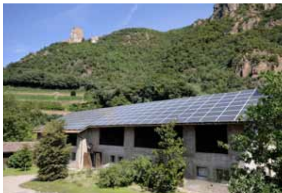
Hofstelle in Terlan